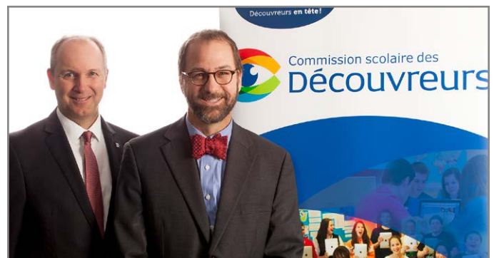
Le directeur général,

Très sincères remerciements à vous toutes et tous qui contribuez à la mission éducative et à la qualité de l'éducation et de la formation. Nous avons raison de dire : Découvreurs en tête.