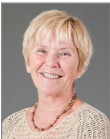
Circonscription 2 – De la Promenade-des-Sœurs Mary Fortier