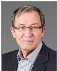
Circonscription 9 – De la Cité-Universitaire Harold Gaboury